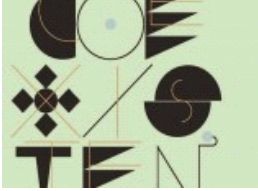
Art in port. Coexistence: for a new Adriatic koinè, mostra itinerante ...