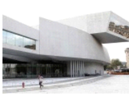
La cultura visuale iraniana in mostra al MAXXI a Roma