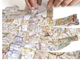
Arte: Bianco- Valente nel Cortile di Palazzo Strozzi: "Tu sei qui"